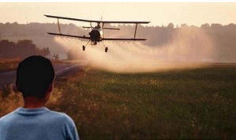
Fotografía tomada en Paraguay. Fuente desconocida, tomada en Paraguay.

Más del 86% de los cultivos transgénicos en el mundo se cultivan en Norte y Sudamérica. El principal impulsor del crecimiento generalizado de los cultivos transgénicos en América del Sur ha sido el uso de soja tolerante al glifosato (o Roundup Ready), que es ahora plantada en más de 55 millones de hectáreas. En 2014 Brasil y Argentina fueron los principales productores de soja RR de América del Sur, con 29 millones y 20,8 millones de hectáreas plantadas, respectivamente. En Argentina esta área ha aumentado en más del doble desde el cambio de siglo, mientras que en Brasil el área de soja RR se ha incrementado en un 778% en el mismo período. 7