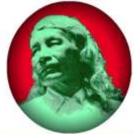
Manuel Quintín Lame